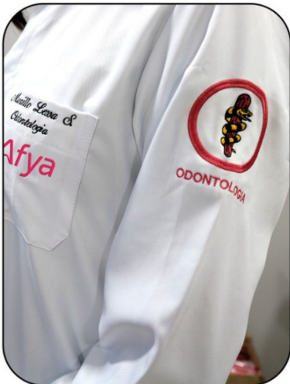
Marca do Curso Bordado lado esquerdo