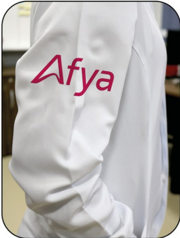
Marca Afya Bordado lado direito

Modelo de Jaleco adotado na instituição seguindo as normas de Biossegurança