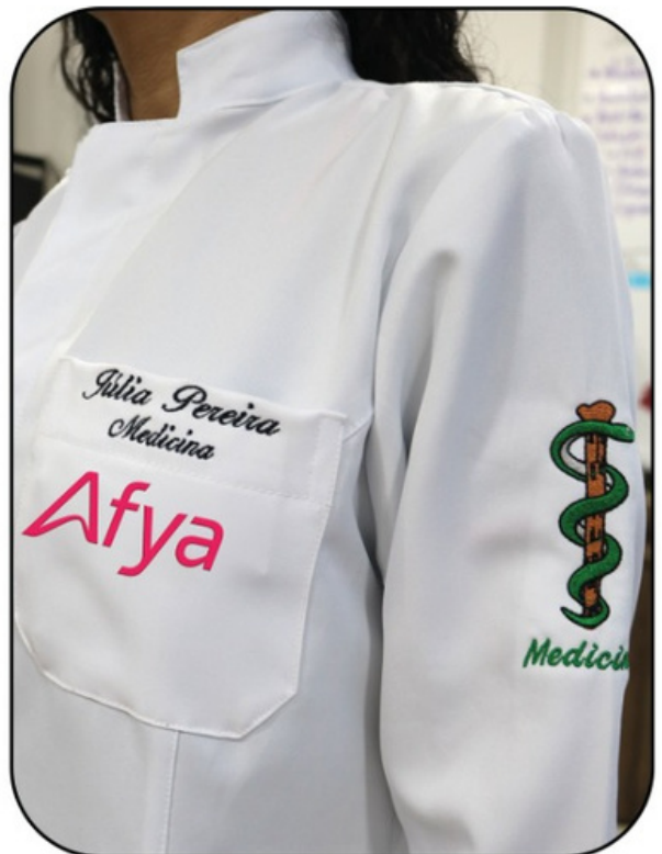
Marca do Curso Bordado lado esquerdo