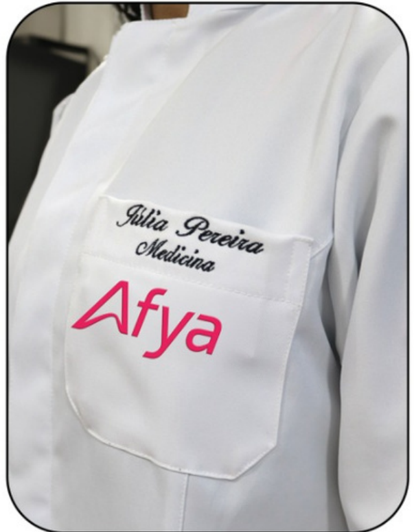
Nome, Curso e Marca Afya Bordado bolso